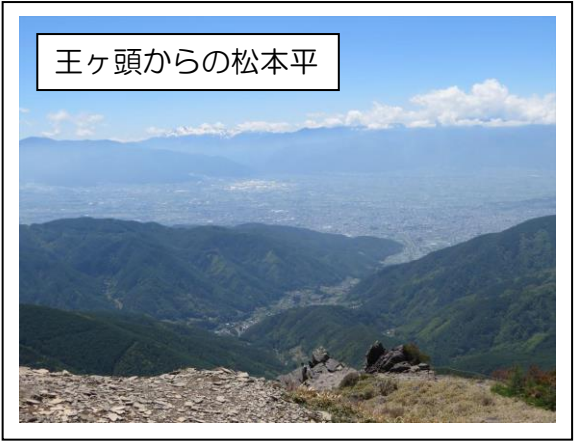
王ヶ頭からの松本平