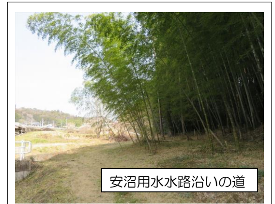
安沼用水水路沿いの道