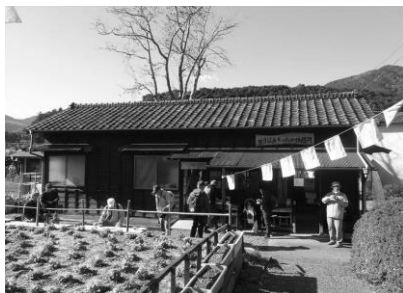
抜里駅 (サヨばあちゃんの休憩所)