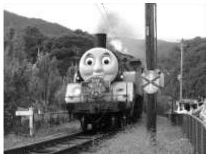
SL トーマス号が見られるかも