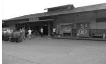
川根温泉ふれあいの泉 露天風呂からのSLは人気です