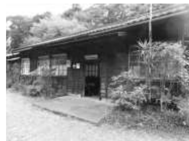
川根温泉笹間渡駅