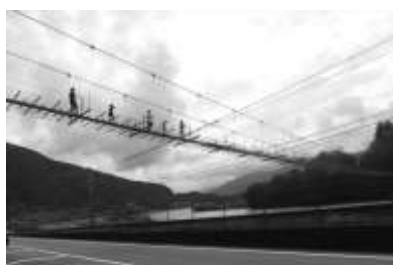
塩郷の吊り橋 苦手な方は迂回路で!