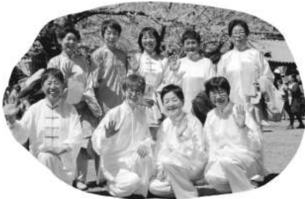
桜の花の下でお仲間と記念写真

太極拳は、ゆっくりとした動きで心身のリズムを調べ、体幹を鍛えるスポーツだそうです。