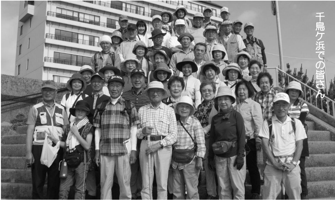
千鳥ヶ浜での皆さん

一泊ウォークに於いては希望者の皆さんより、旅の中で感じられた思いを俳句と川柳にして頂いております。