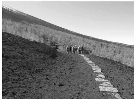
見晴らしの良い御中道