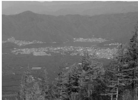
御中道からの眺望