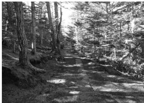
スタート直後の御中道