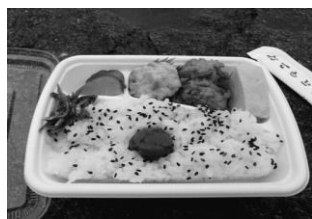
今年のお弁当はどんなかな？