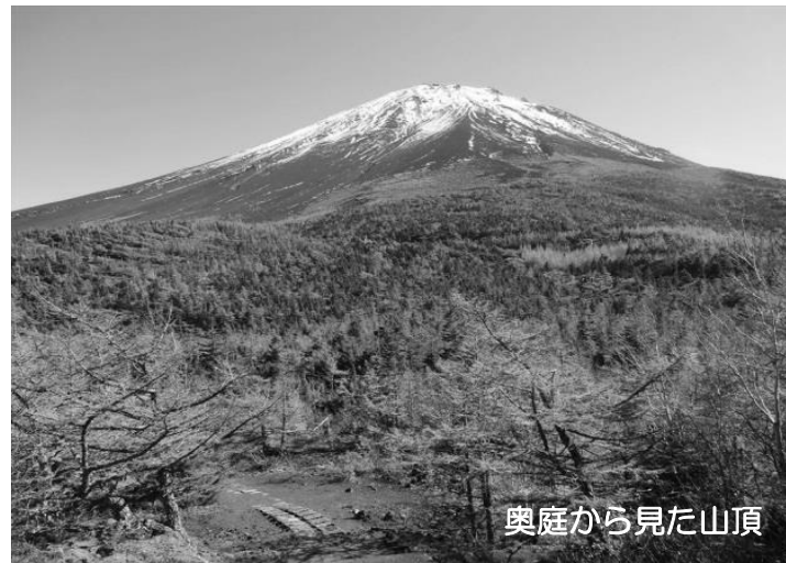
奥庭から見た山頂