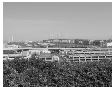
港の見える丘公園