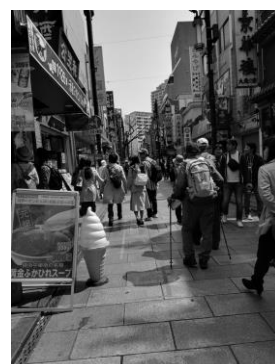
中華街を歩きます