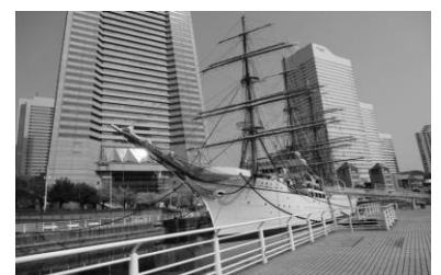
係留された日本丸