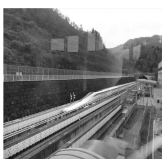
展望室からのリニア