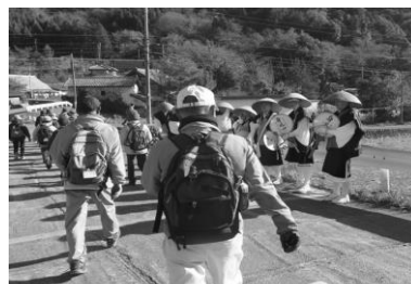
寒行のお坊さんにも会いました