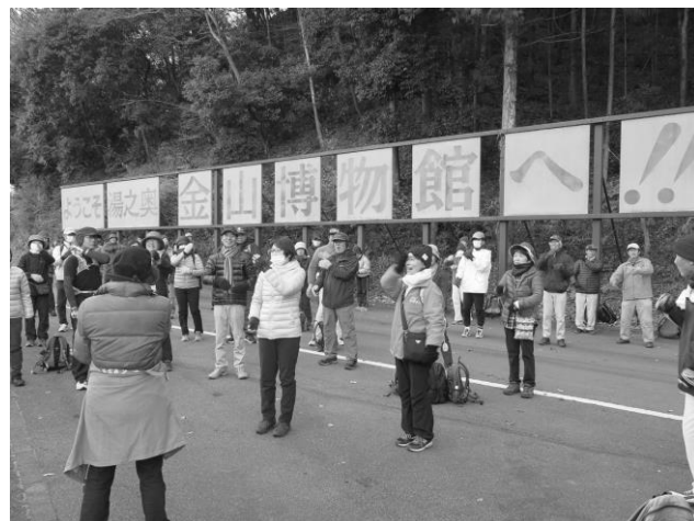
体操をしてからいよいよスタートです

昨年は 79 名の方がチャレンジウォークに挑戦されました。皆さん無理せず歩けるところまで歩かれました。昨年のスナップをご覧ください。