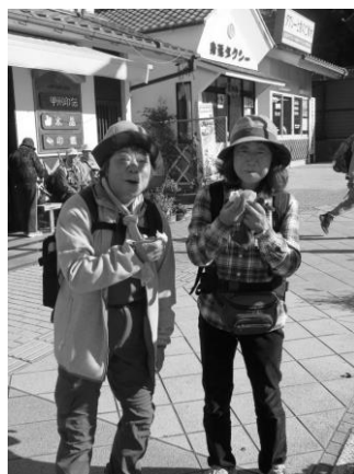
身延駅では美味しいコロッケに思わずにっこり