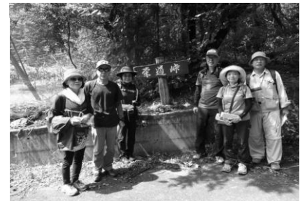
茶道峠での 下見メンバー