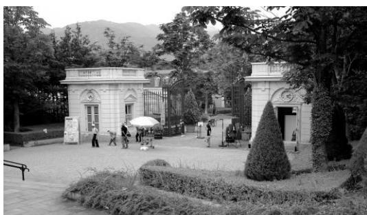
バガテル公園で昼食