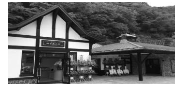
南アルプスプラザ

行程 往路(バス) 富士宮駅 ⇒ 南アルプスプラザ ウォーク 南アルプスプラザ・・・赤沢宿(散策)・・・羽衣白糸の滝(昼食)・・・ 南アルプスプラザ・・・早川町役場・・・早川左岸・・・県道37早川SS前(ゴール) ※ゆったりは南アルプスプラザからタクシー(400円/人)で赤沢宿まで ※早川左岸ウォークは希望者のみ 復路(バス) 早川SS前 ⇒ 道の駅なんぶ ⇒ 富士宮駅