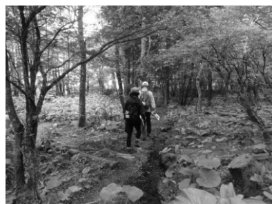
遊歩道を行く下見メンバー