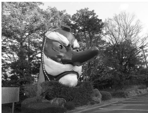
春野文化センターにある日本の天狗面 顔面高は8呎で天狗面に合う身長は50呎になるそうです。