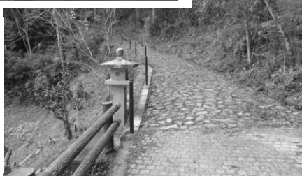
秋葉山上社に向かう参道