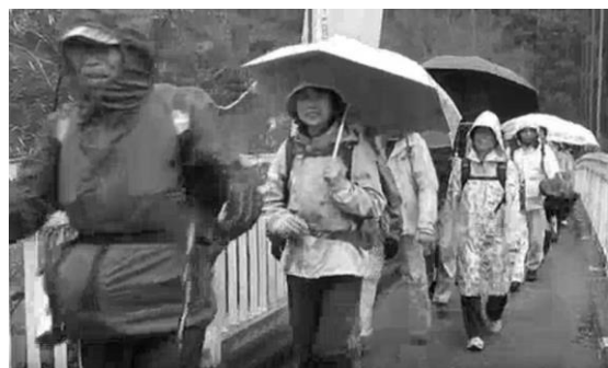
2015年は雨のスタートでした