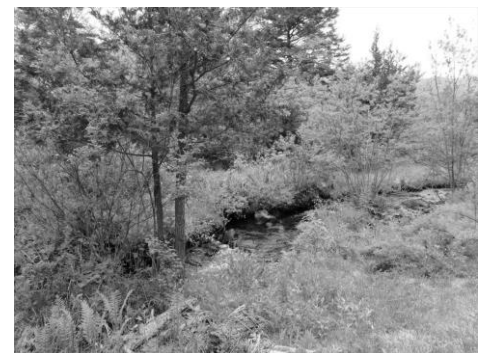
一の瀬園地の清流

昼食場所のネイチャープラザには食堂がありますが、雨天の場合は別の場所での昼食になり、こちらには食堂がありません。天候を見ながらのご判断になります。