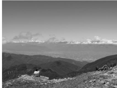
王ヶ頭からみる松本平とアルプス