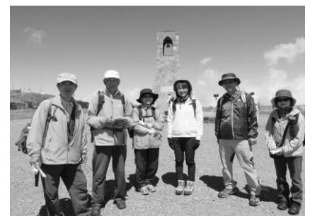
美しい塔と下見メンバー