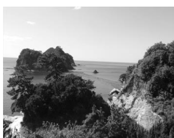
トンボロ：潮位が低くなり島が繋がる現象