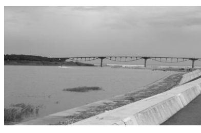
ゴール近くの 潮騒橋