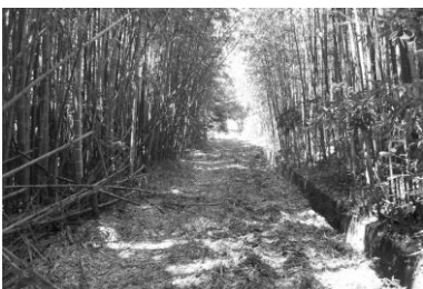
竹林の中を 軽便は走った