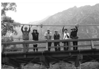
河童橋での下見メンバー