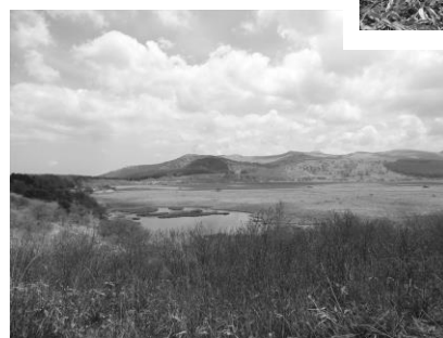
← 夏の八島ヶ原湿原 華麗な花たちが主役 その数は360種もの 植物が自生する。