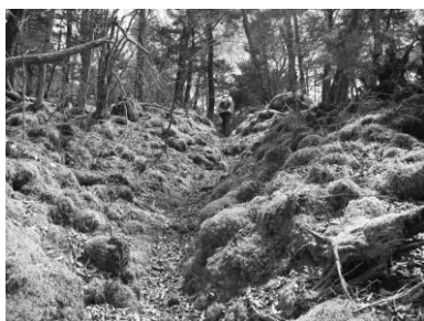
苔に覆われた古道