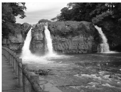
天然記念物 五竜の滝

川沿いの道を歩くのは気持ちの良いものですが、第4ステージでは黄瀬川沿いを歩きます。この川は御殿場市に源を発し、溶岩の流れた跡が目立ち、途中には富士溶岩の断崖にかかる五竜の滝や鮎壺の滝があります。今回は五竜の滝のある裾野市中央公園で昼食です。五条の滝がしぶきをあげて落ちるさまは見ごたえがあります。ゆったりコースに加え、超ゆったりコースも用意しました。ゆったりは岩波駅と裾野駅の中間の市民文化センターがゴール、超ゆったりは中央公園でウォークを終了、その後はバスで市民文化センターに寄り、ここで時間を過ごした後、ゆったりと一緒にバスで裾野駅に向かいます。