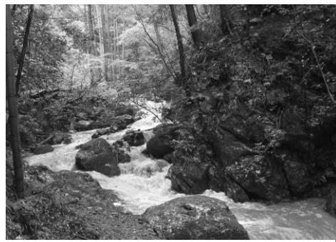
午前中は沢歩きもあり 沢ガニも見られ自然が一杯です。