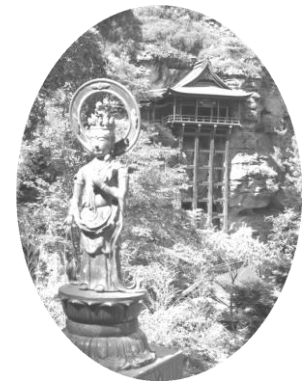
断崖絶壁にかかる観音堂 苦勞して登れば観音様が迎えてくれます。