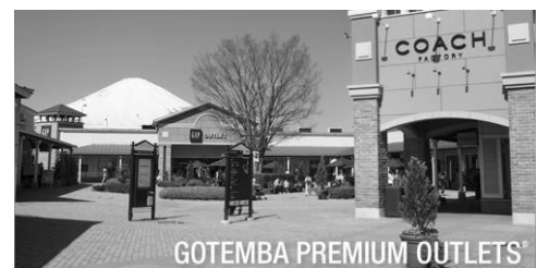
御殿場プレミアムアウトレット (昼食会場)