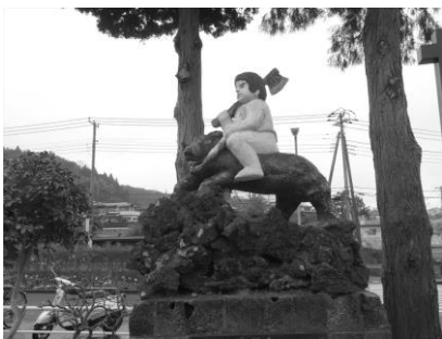
足柄駅前の金太郎像

第1、第2ステージに参加した人は勿論、初めての人も是非参加してください。全ステージ参加された方には完歩賞が出ます。惜しくも全ステージを歩けなかった方は後から個人で歩いて完歩賞の対象です。電車が利用できますからこれが可能です。地図はいつでも差し上げます。何人か声を掛け合って一緒に歩くのもいいですね。事務局に相談してみてください。