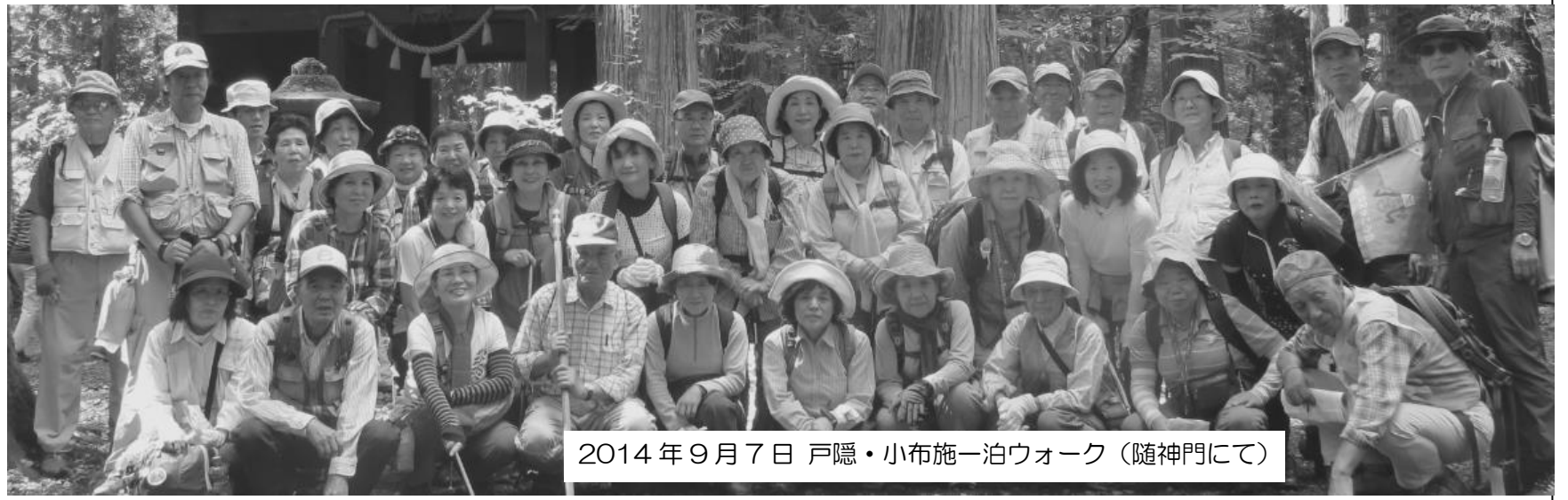
2014年9月7日 戸隠・小布施一泊ウォーク（随神門にて）